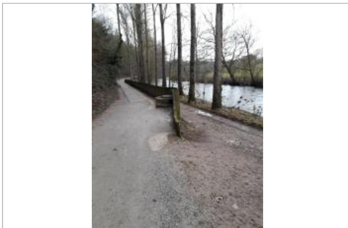
Vue du site - Auteur : Topodoc