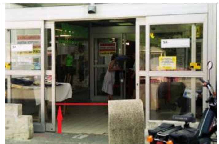
Devanture du magasin, le trait rouge indiquant le niveau de l'eau

Maximum de l'inondation : Oui Visibilité : Oui État du repère : Disparu Pérennité : Aucune