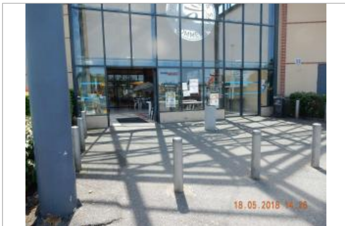
Devanture du magasin en mai 2018