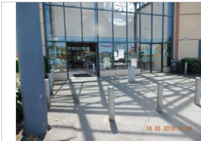
Devanture du magasin en mai 2018

Coordonnées WGS84 : X: 0.61799265 / Y: 48.76350500