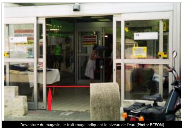
Devanture du magasin, le trait rouge indiquant le niveau de l'eau

Altitude calculée de l'eau (en m) : 201.59