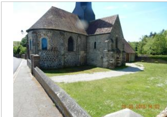
Cour de l'église