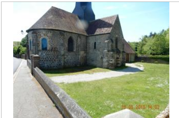
Cour de l'église