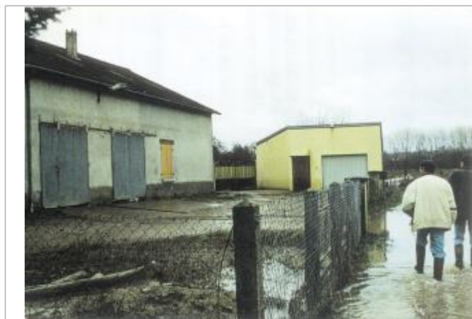
Le niveau a presque atteint le bas de la fenêtre, visible avec la marque d'inondation

Code : WEB_R_201805240949 Date de mise à jour : 20/11/2018 Auteur : Ghubert