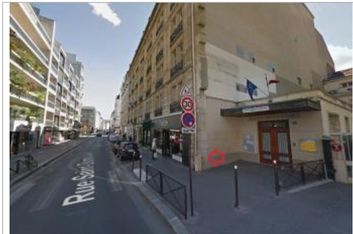
Vue du site - source : Google Street View (2017)