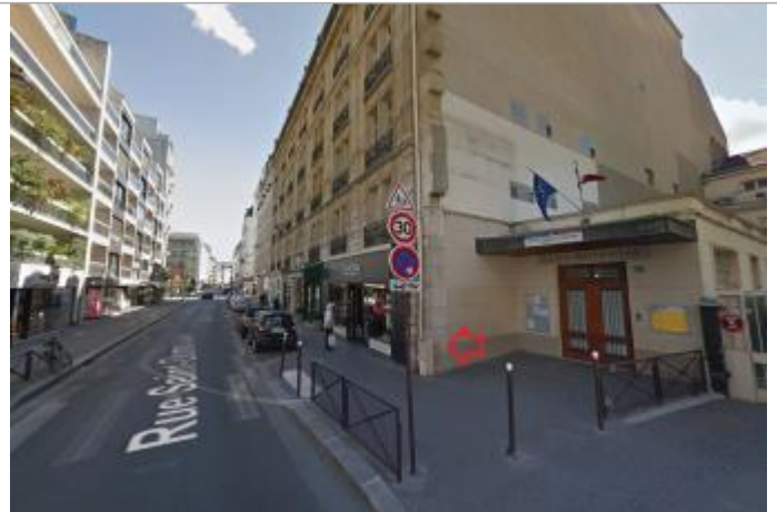
Vue du site - source : Google Street View (2017)