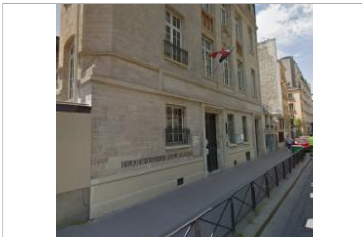
Vue du site - source : Google Street View (2016)

Coordonnées WGS84 : X: 2.36108906 / Y: 48.84246980 Coordonnées RGF93 (Lambert 93) X: 653108.51 / Y: 6860458.8 Coordonnées RGF93 (ETRS89) : X: 2.3610891 / Y: 48.8424698 Code Hydro : ----0010 Rive de référence : Gauche