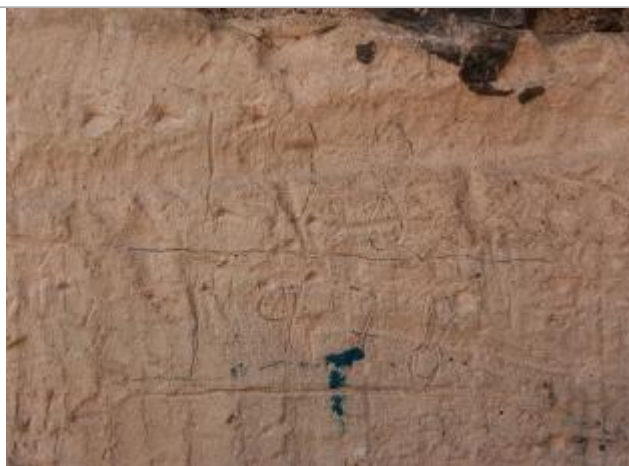
Marques 1982 (décembre) et 1978 - côté amont

Altitude calculée de l'eau (en m) : 62.81 m