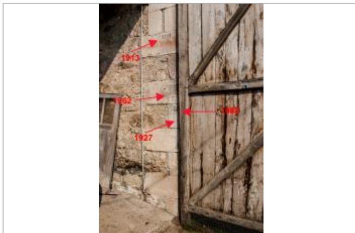
Marques grange vers aval