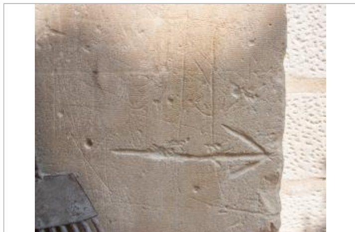
Marque 1944 (1)

SOURCE DE REPÉRAGE : RECENSEMENT DES REPÈRES DE CRUES PAR L'EPTB VIENNE - PHASE OPÉRATIONNELLE DU PAPI VIENNE AVAL - 09/04/2018