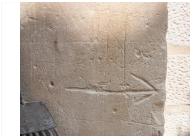
Marque 1944 (1)

SOURCE DE REPÉRAGE : RECENSEMENT DES REPÈRES DE CRUES PAR L'EPTB VIENNE - PHASE OPÉRATIONNELLE DU PAPI VIENNE AVAL - 09/04/2018