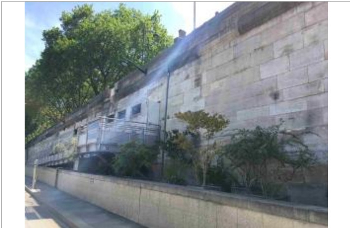
Vue depuis la promenade