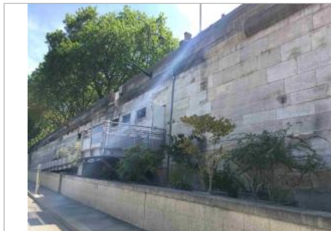
Vue depuis la promenade