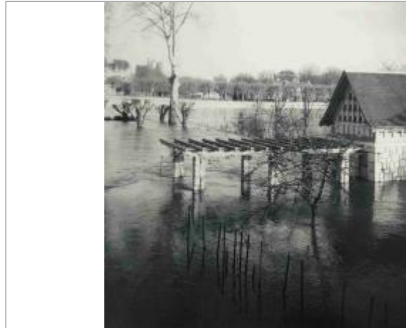
Crue de 1962