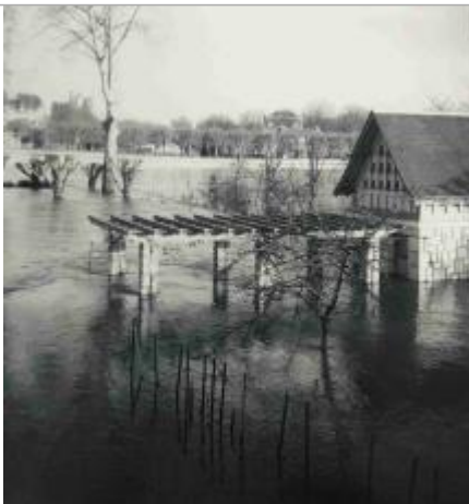
Crue de 1962 / Photo : P. Sailhan

Organisme : Etablissement public du bassin de la Vienne