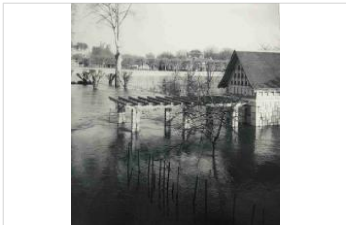
Crue de 1962

Organisme(s) : Etablissement public du bassin de la Vienne