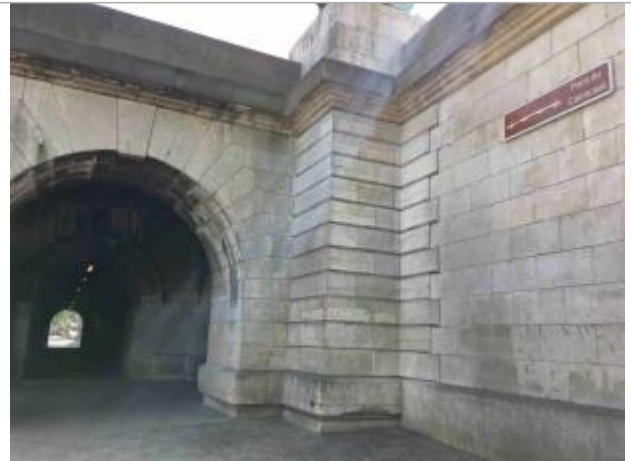
Vue depuis le bas quai