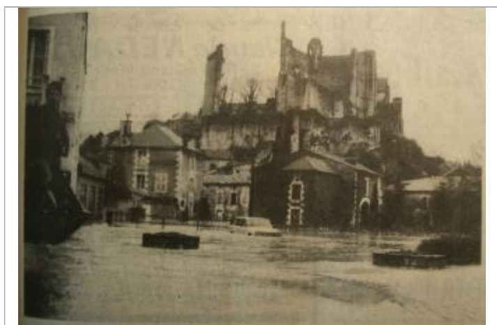
Crue du Talbat du 20 décembre 1982 - parking du jardin public / Credit photo : Centre-Presse

Type de repérage : Campagne de terrain post-inondation Organisme(s) : Etablissement public du bassin de la Vienne