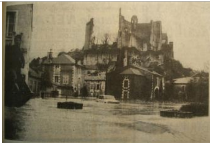
Crue 20 décembre 1982 - parking du jardin public