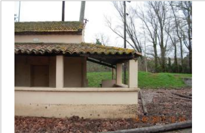
Mur extérieur de la terrasse couverte du local près du jeux de boule

GÉOLOCALISATION Coordonnées WGS84 : X: 2.41017450 / Y: 43.25511030 Coordonnées RGF93 (Lambert 93) X: 652074.4 / Y: 6239725.89 Coordonnées RGF93 (ETRS89) : X: 2.4101745 / Y: 43.2551103 Code Hydro: Y1410500 Rive de référence: