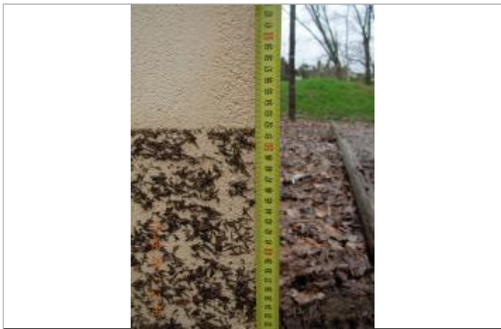
Mur extérieur de la terrasse couverte du local près du jeux de boule

DDTM/SPRISR - 15/02/2017 Système altimétrique : NGF IGN 1969 (système normal) Différence entre le niveau d'eau et la référence (en m) : 0.517 m