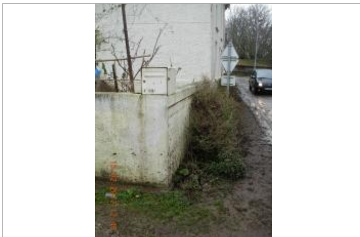
Angle de mur de clôture