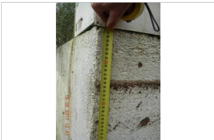
angle mur de clôture

Système altimétrique : NGF IGN 1969 (système normal) Différence entre le niveau d'eau et la référence (en m) : 0.955 m