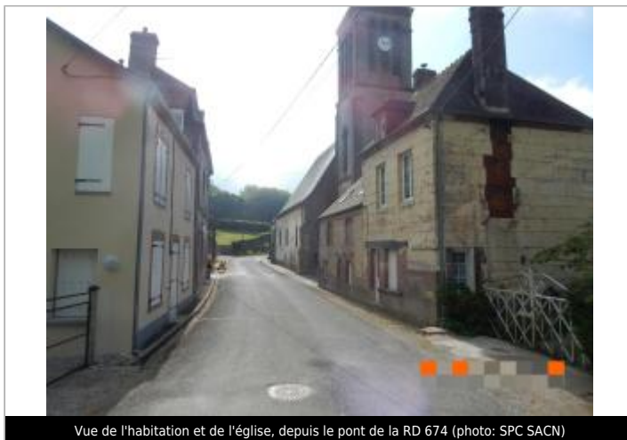
Vue de l'habitation et de l'église, depuis le pont de la RD 674