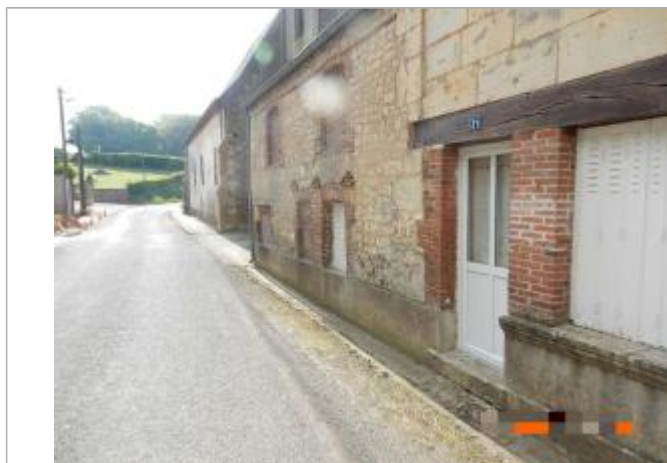
Niveau d'eau a atteint le haut de la marche du seuil