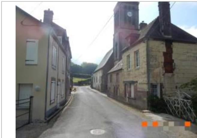
Vue de l'habitation et de l'église, depuis le pont de la RD 674