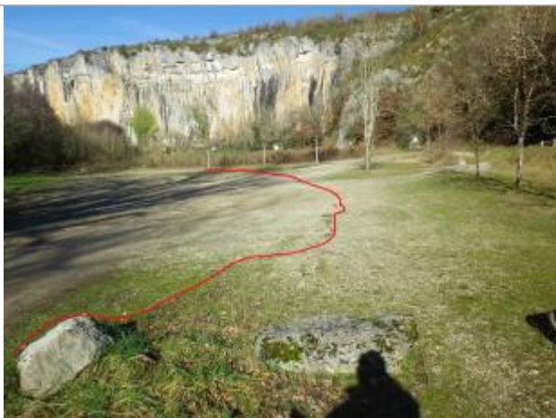
Vue de la laisse d'inondation - Auteur : GEOSPHAIR

Altitude calculée de l'eau (en m) : 137.72 m