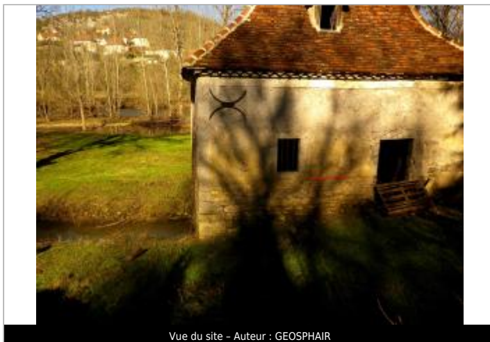
Vue du site - Auteur : GEOSPHAIR