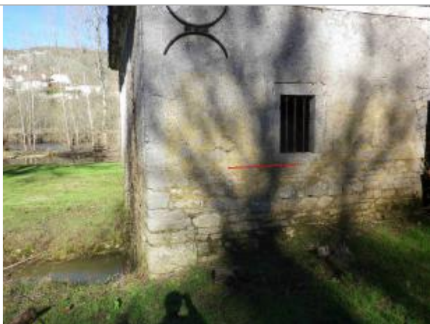
Vue de la laisse d'inondation

Différence entre le niveau d'eau et la référence (en m) : 1.450 m