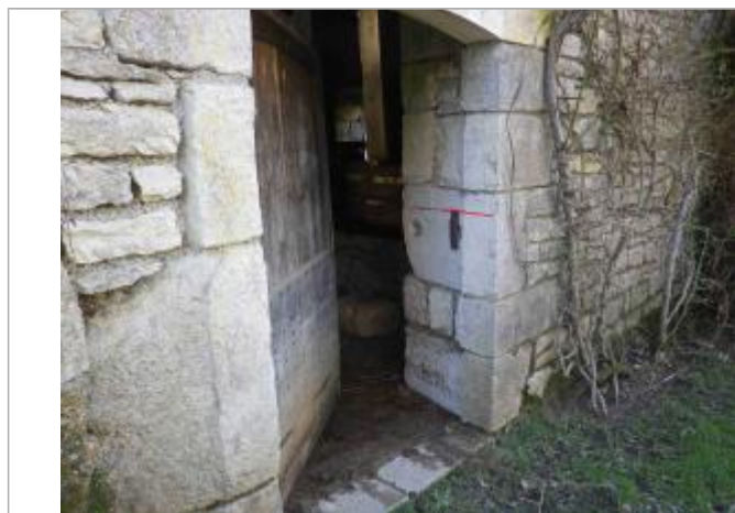
Vue de la laisse d'inondation - Auteur : GEOSPHAIR