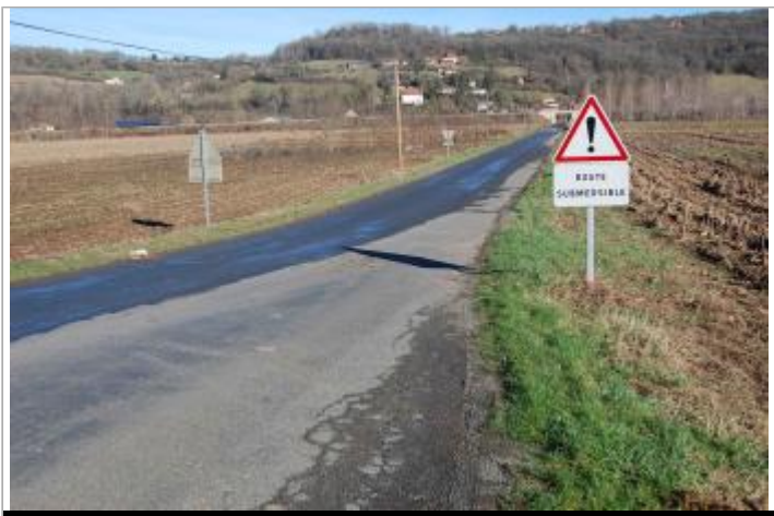
Vue du site - Auteur : GEOSPHAIR

GÉOLOCALISATION Coordonnées WGS84 : X: 1.98492660 / Y: 44.58913000 Coordonnées RGF93 (Lambert 93) X: 619428.41 / Y: 6388300.65 Coordonnées RGF93 (ETRS89) : X: 1.9849266 / Y: 44.58913 Code Hydro: O8--0150 Rive de référence: Droite