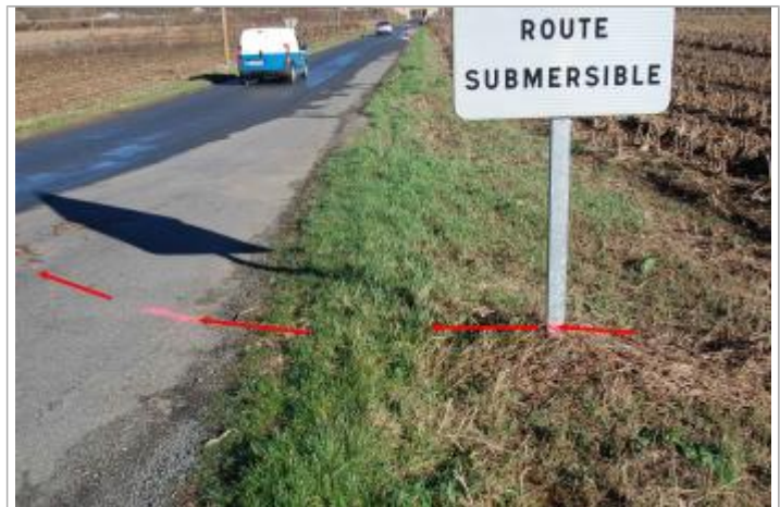
Vue de la laisse d'inondation

GÉNÉRAL Code : GTL_18-01_R_170_1 Date de mise à jour : 22/06/2018 Auteur : SPC GTL