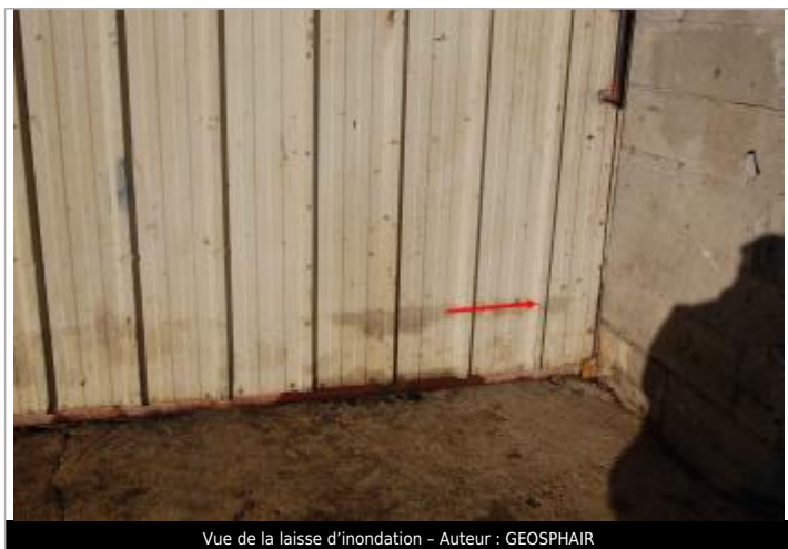
Vue de la laisse d'inondation