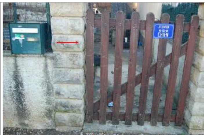
Vue de la laisse d'inondation

Maximum de l'inondation : Oui Visibilité : Non État du repère : Disparu Pérennité : Aucune Repère calculé : Non renseigné PHEC : Non renseigné