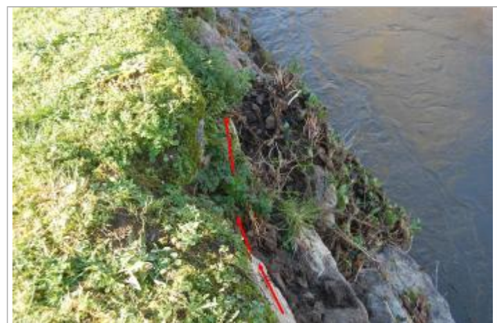
Vue de la laisse d'inondation