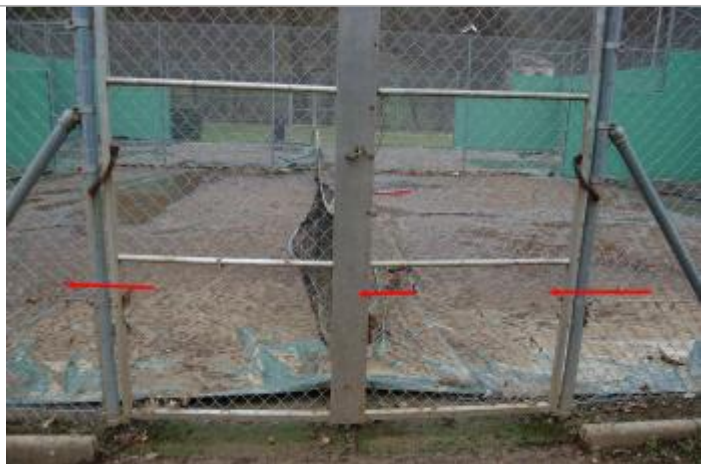
Vue de la laisse d'inondation

Altitude calculée de l'eau (en m) : 198.9 m