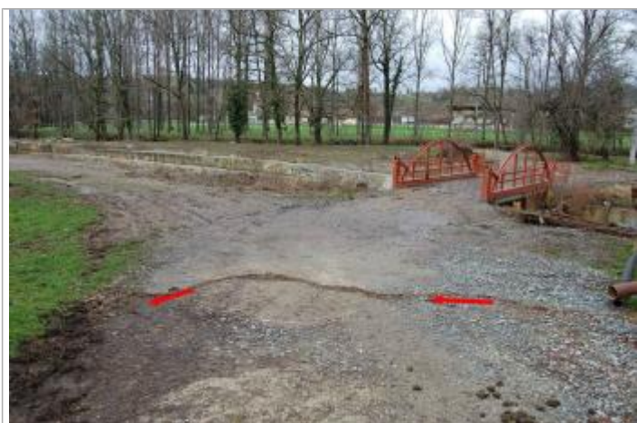
Vue de la laisse d'inondation - Auteur : GEOSPHAIR

Altitude calculée de l'eau (en m) : 230.21 m