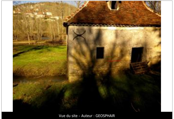
Vue du site - Auteur : GEOSPHAIR