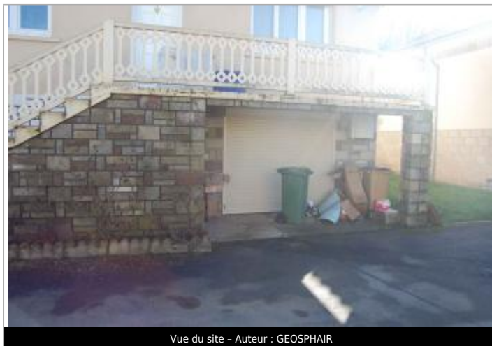
Vue du site - Auteur : GEOSPHAIR

Coordonnées WGS84 : X: 2.02153270 / Y: 44.60515890