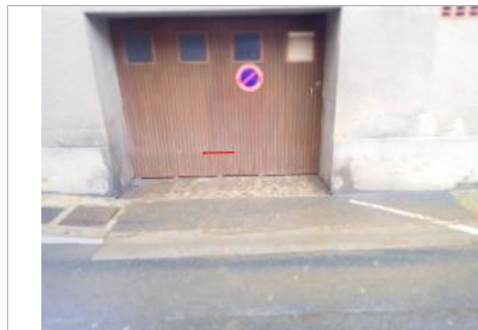
Vue de la laisse d'inondation - Auteur : Syndicat du Bassin de la Rance et du Célé

Méthode : GPS Organisme : GEOSPHAIR Référence nivelée : Autre type de référence Description référence du repère : le seuil du portail Système altimétrique : NGF IGN 1969 (système normal) Altitude de la référence (en m) : 193.460 m Différence entre le niveau d'eau et la référence (en m) : 0.300 m Altitude calculée de l'eau (en m) : 193.76