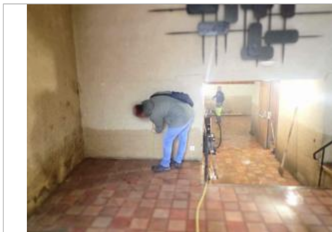
Vue de la laisse d'inondation - Auteur : Syndicat du Bassin de la Rance et du Célé

Altitude calculée de l'eau (en m) : 193.7