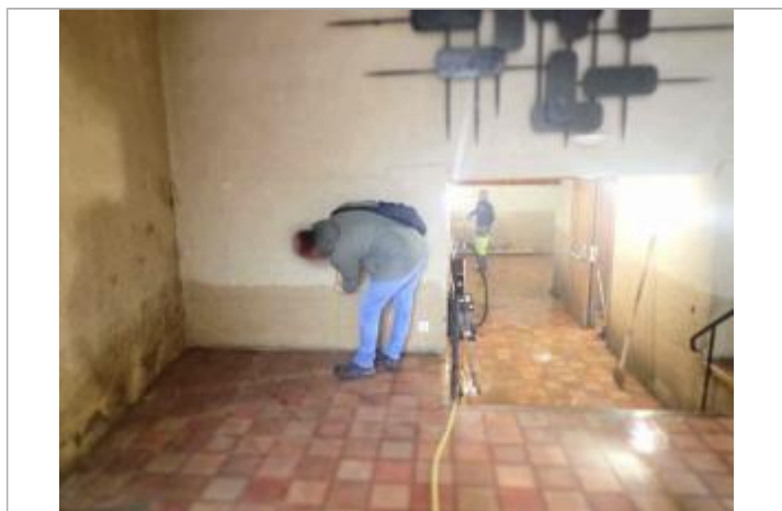
Vue de la laisse d'inondation - Auteur : Syndicat du Bassin de la Rance et du Célé

Altitude calculée de l'eau (en m) : 193.7