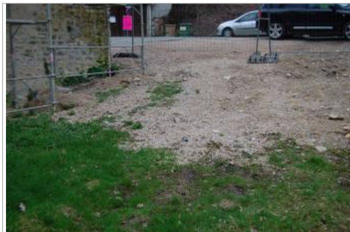
Vue du site - Auteur : GEOSPHAIR