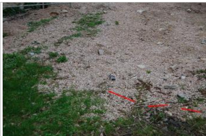
Vue de la laisse d'inondation - Auteur : GEOSPHAIR

Altitude calculée de l'eau (en m) : 195.92