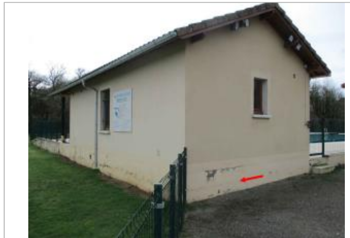
Vue du site - Auteur : DDT46