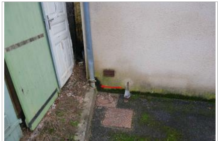
Vue de la laisse d'inondation

GÉNÉRAL Code : GTL_R_6754_2 Date de mise à jour : 22/06/2018 Auteur : SPC GTL