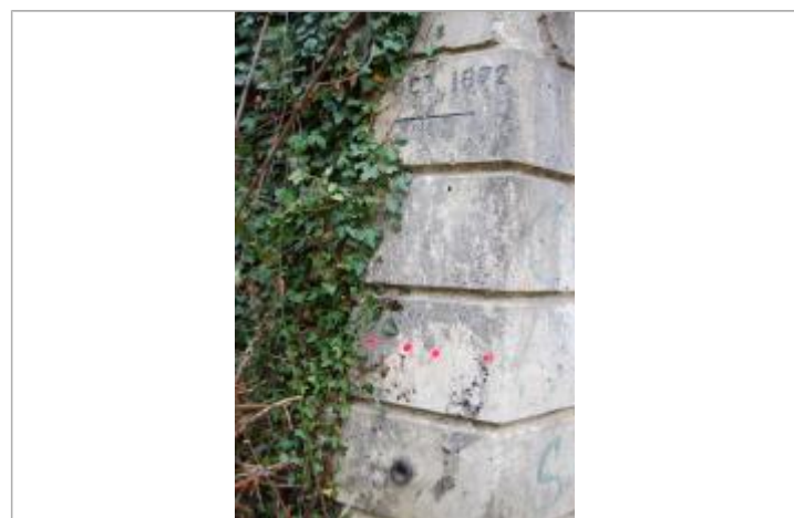
Vue de la laisse d'inondation

GÉNÉRAL Code : IGN_R_P'.A.T3-29-I_2 Date de mise à jour : 25/05/2018 Auteur : SPC GTL