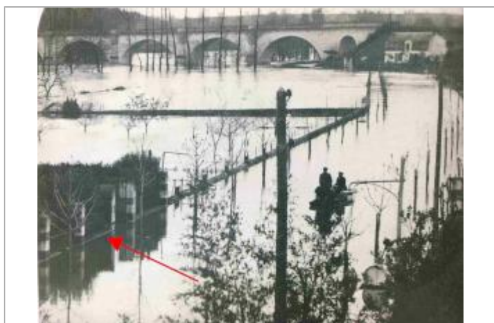
Av. Aristide Briand en 1913

Maximum de l'inondation : Non renseigné Visibilité : Non État du repère : Disparu Pérennité : Aucune Repère calculé : Non PHEC : Oui