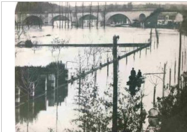
Av. Aristide Briand en 1913