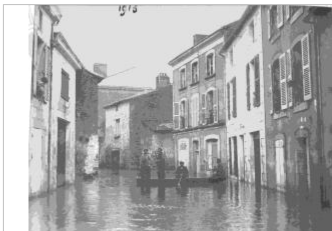
Rue de Châtelleraut - crue 1913

SOURCE DE REPÉRAGE : RECENSEMENT DES REPÈRES DE CRUES PAR L'EPTB VIENNE - PHASE OPÉRATIONNELLE DU PAPI VIENNE AVAL - 09/04/2018