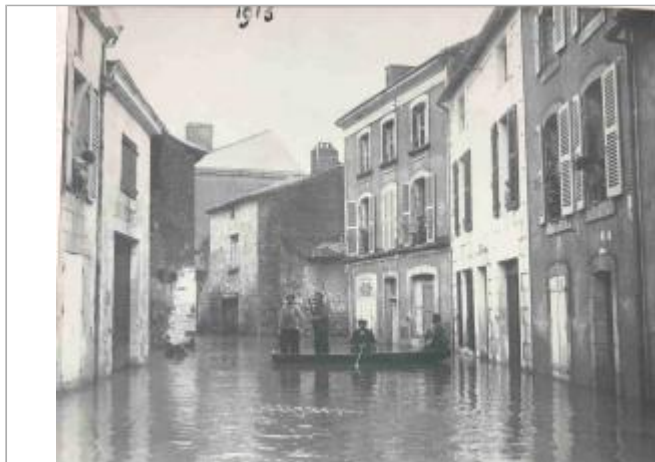
Rue de Châtelleraut - crue 1913