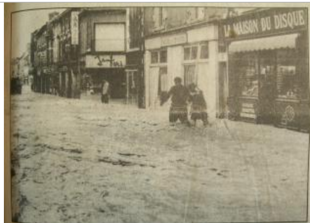
Crue du Talbat du 20 décembre 1982 - rue de Saint-Savin

Organisme(s) : Etablissement public du bassin de la Vienne