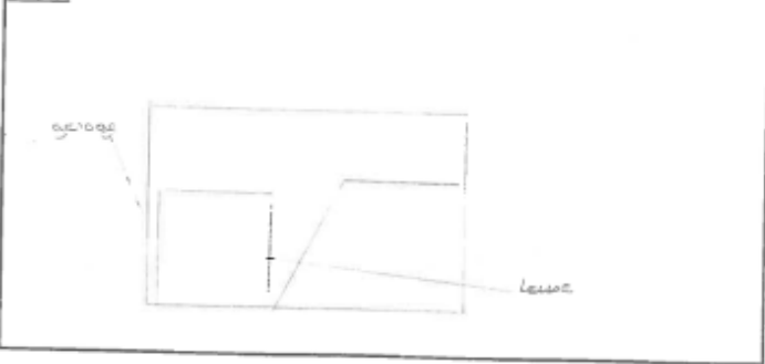
Croquis laisse d'inondation 1982