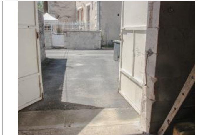
Grange du n°3 rue du port

Coordonnées WGS84 : X: 0.59853857 / Y: 46.60808000