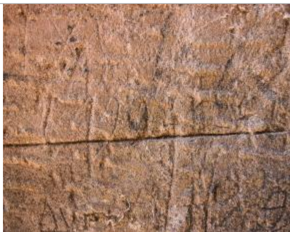
Marque 62 et 1994

Organisme(s) : Etablissement public du bassin de la Vienne