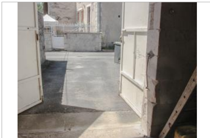
Grange du n°3 rue du port