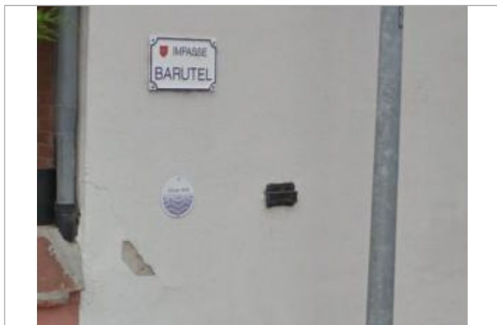
Vue des repères