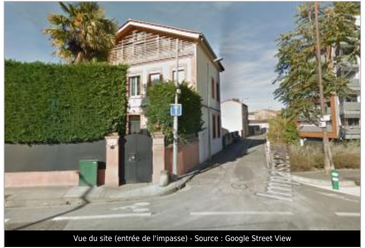
Vue du site (entrée de l'impasse)

Coordonnées WGS84 : X: 1.42025000 / Y: 43.60265000