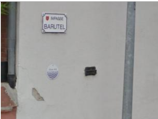
Vue des repères

Altitude calculée de l'eau (en m) : 136.02 m