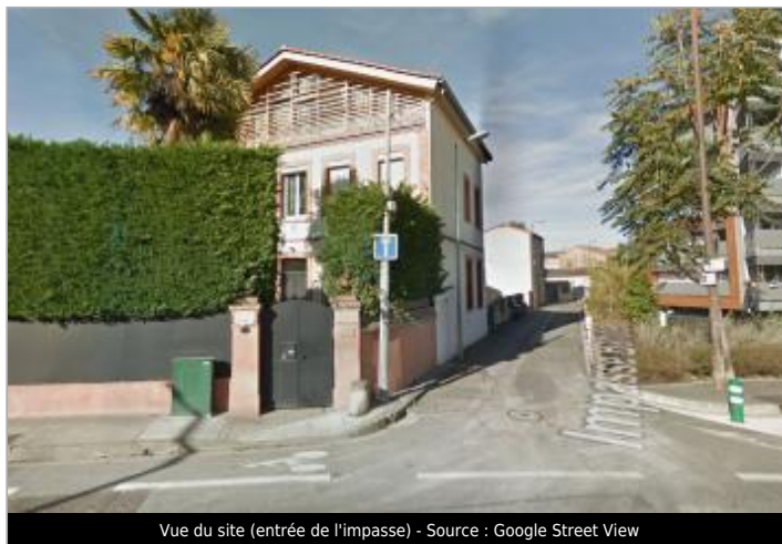
Vue du site (entrée de l'impasse)