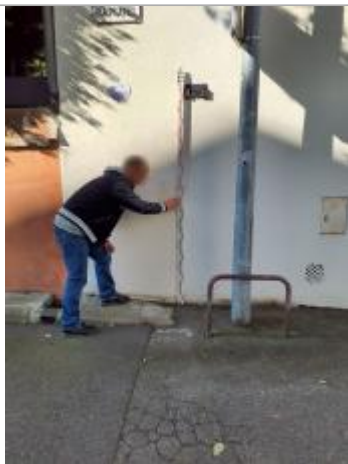
Photo du repère - mesure 1,93 m

Altitude calculée de l'eau (en m) : 135.996 m