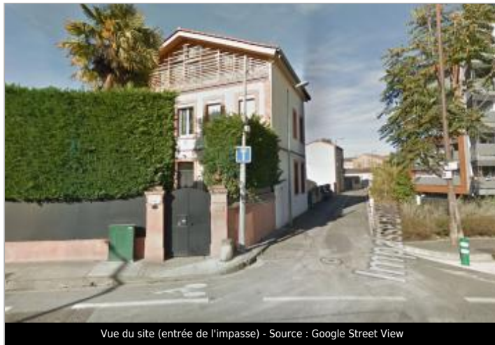
Vue du site (entrée de l'impasse) - Source : Google Street View

Coordonnées WGS84 : X: 1.42025000 / Y: 43.60265000