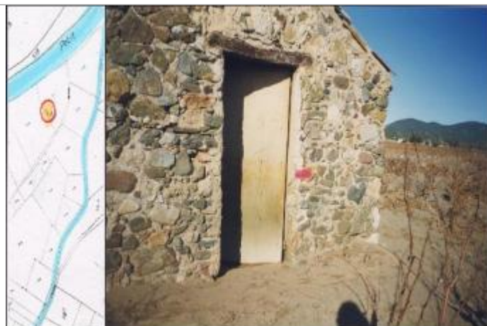
Cabane de vigne