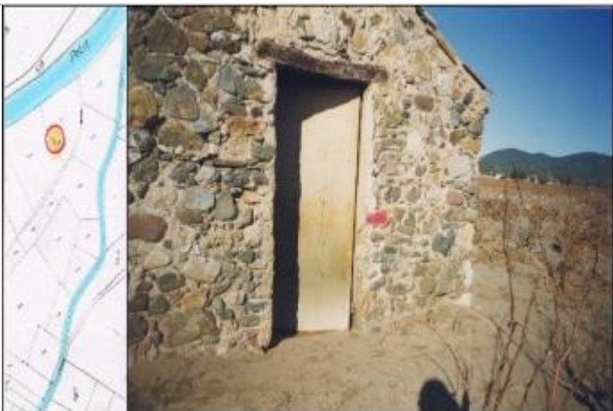
Cabane de vigne

Altitude calculée de l'eau (en m) : 146.11 m