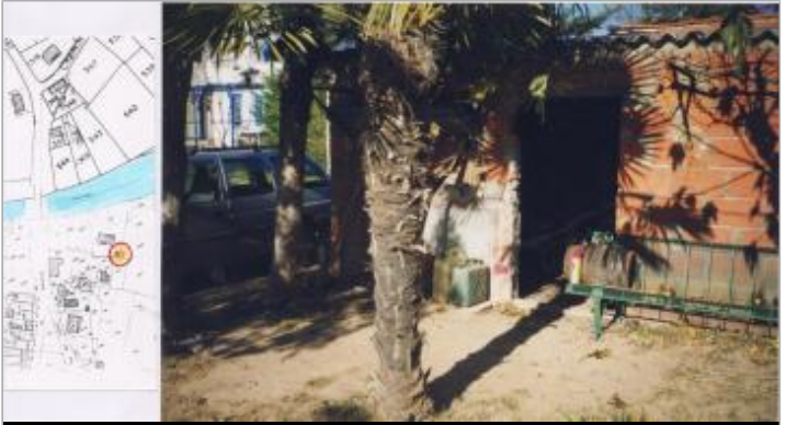
Cabane de jardin

GÉOLOCALISATION Coordonnées WGS84 : X: 2.72397490 / Y: 42.88609100 Coordonnées RGF93 (Lambert 93) X: 677428.31 / Y: 6198556.76 Coordonnées RGF93 (ETRS89) : X: 2.7239749 / Y: 42.886091 Code Hydro: Y0650500 Rive de référence: