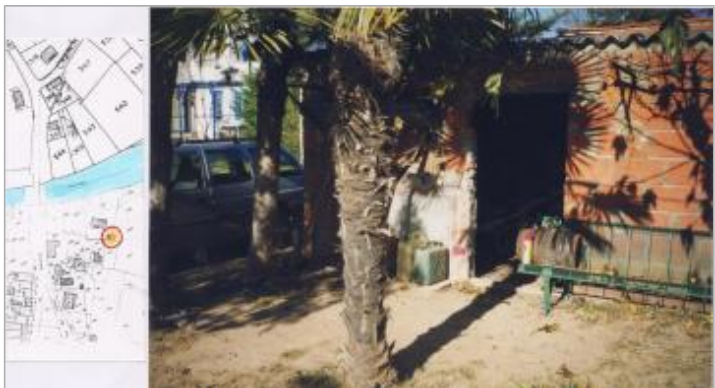
Cabane de jardin

ENQUÊTE DDE - 06/12/1999 Système altimétrique : NGF IGN 1969 (système normal) Altitude de la référence (en m) : 147.820 m Différence entre le niveau d'eau et la référence (en m) : 0.300 m Altitude calculée de l'eau (en m) : 148.12