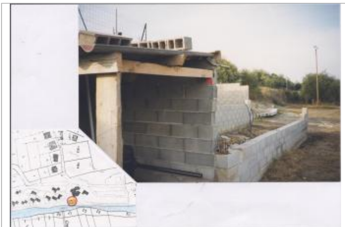
Local technique de la piscine