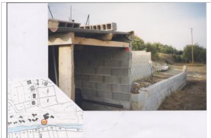
Local technique de la piscine

Système altimétrique : NGF IGN 1969 (système normal) Altitude de la référence (en m) : 150.100 m Différence entre le niveau d'eau et la référence (en m) : 1.900 m Altitude calculée de l'eau (en m) : 152 m